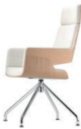
S 843 E