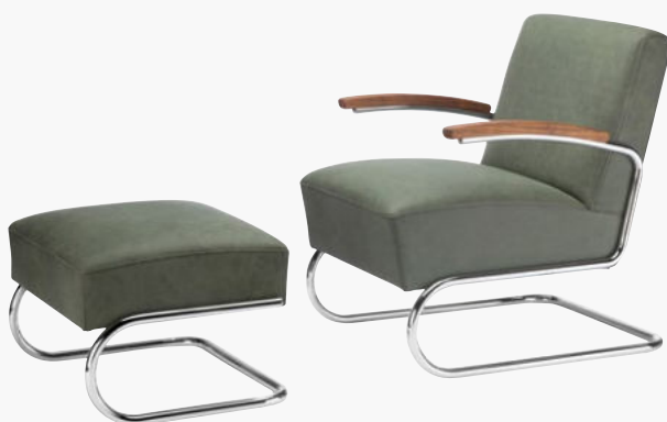
S 411 H, S 411 PURE MATERIALS