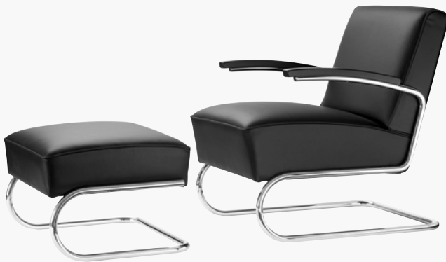
S 411 H, S 411 VOLLUMPOLSTERT FULL UPHOLSTERY