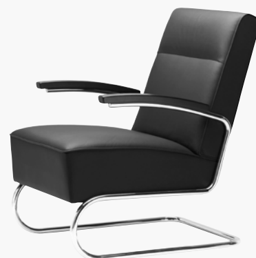
S 412 MIT HOHER RÜCKENLEHNE WITH HIGH BACKREST