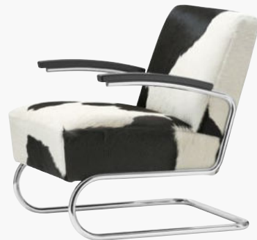
S 411 LV MIT KUHFEHLEBEZUG WITH COWHIDE COVER