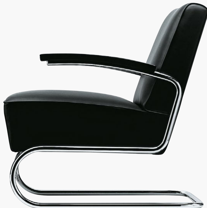
S 411 VOLLUMPOLSTERT FULL UPHOLSTERY

Armchair with two different backrest heights and footstool, frames chrome-plated or lacquered tubular steel in various colours, covers in fabric, cowhide or leather as well as natural Napa leather with comfort cushion. Armrests in solid stained beech wood or oiled walnut, oak and ash. Also available in "Pure Materials" versions.