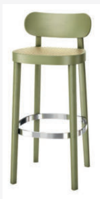
118 H ROHRGEFLECHT/ WICKERWORK