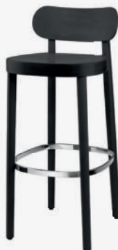
118 MH MULDENSITZ/ MOULDED PLYWOOD SEAT