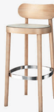
118 SPH SITZ MIT SPIEGELPOLSTERUNG/ SEAT UPHOLSTERED