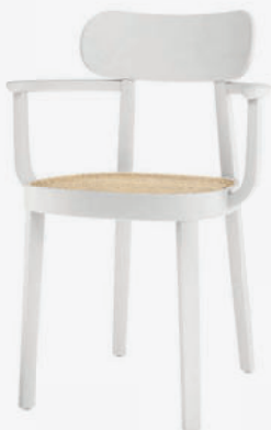
118 F ROHRGEFLECHT/ WICKERWORK