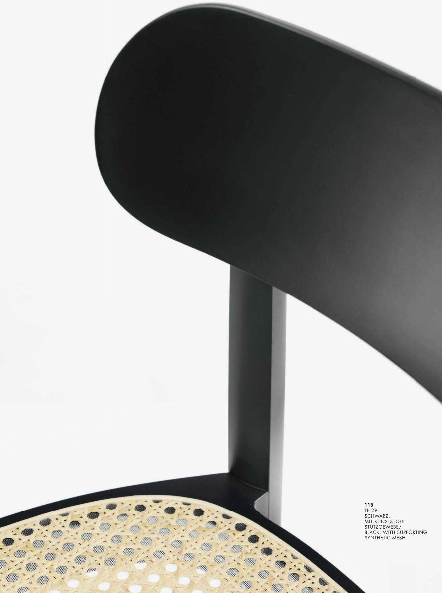
118 TP 29 SCHWARZ, MIT KUNSTSTOFF- STÜTZGEWEBE/ BLACK, WITH SUPPORTING SYNTHETIC MESH