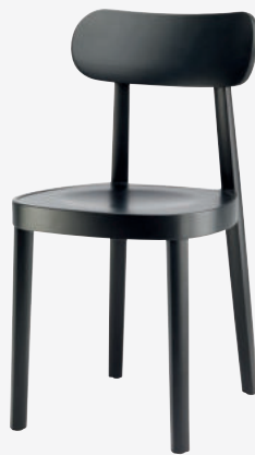
118 M MULDENSITZ/ MOULDED PLYWOOD SEAT