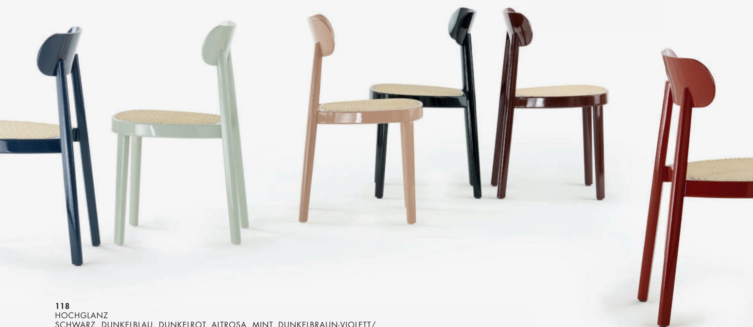
118 HOCHGLANZ SCHWARZ, DUNKELBLAU, DUNKELROT, ALTROSA, MINT, DUNKELBRAUN-VIOLETT/ HIGH GLOSS BLACK, DARK BLUE, DARK RED, ANTIQUE PINK, MINT, DARK BROWN-VIOLET

The bent seat frame and the hand crafted seat covered with wickerwork refer to the original archetype of a Thonet chair, no. 214. The chair 118 is optionally available with a moulded seat or seat upholstered.