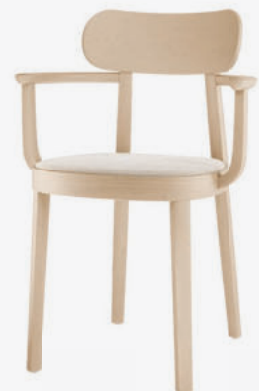
118 SPF SITZ MIT SPIEGELPOLSTERUNG/ SEAT UPHOLSTERED