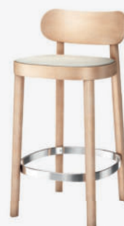
118 SPHT SITZ MIT SPIEGELPOLSTERUNG/ SEAT UPHOLSTERED