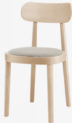
118 SP SITZ MIT SPIEGELPOLSTERUNG/ SEAT UPHOLSTERED