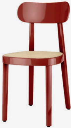
118 ROHRGEFLECHT/ WICKERWORK