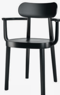
118 MF MULDENSITZ/ MOULDED PLYWOOD SEAT