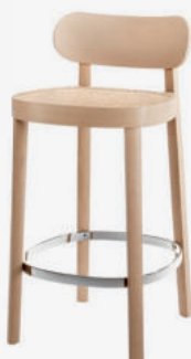
S 118 HT ROHRGEFLECHT/ WICKERWORK