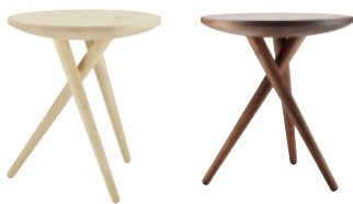
Esche / Ash