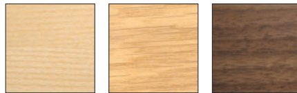
Esche / Ash