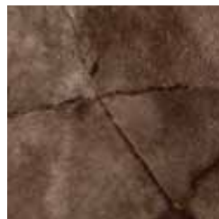
mussman marrone brown musman