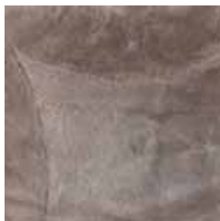
natural beige beige natural