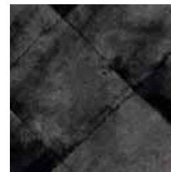
brisa grigio grey brisa