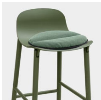
Lips—R removable cushion