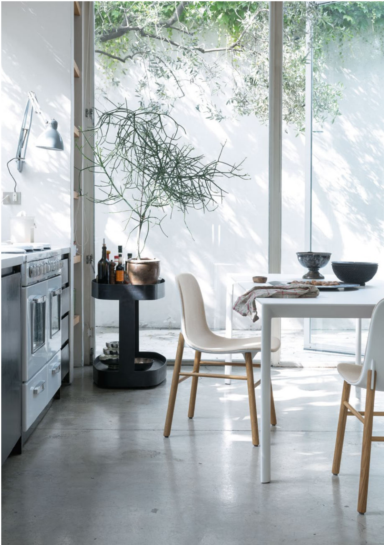
Sharky chair - wooden base Frontal upholstered Hero fabric