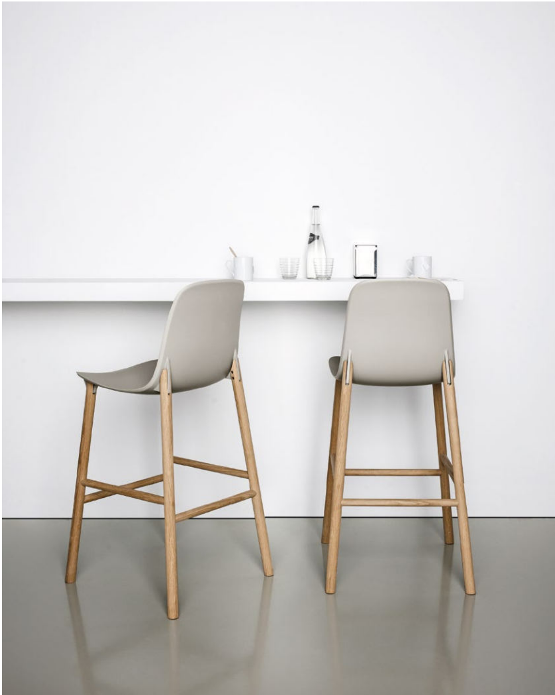
Sharky stool - wooden base High back polyurethane