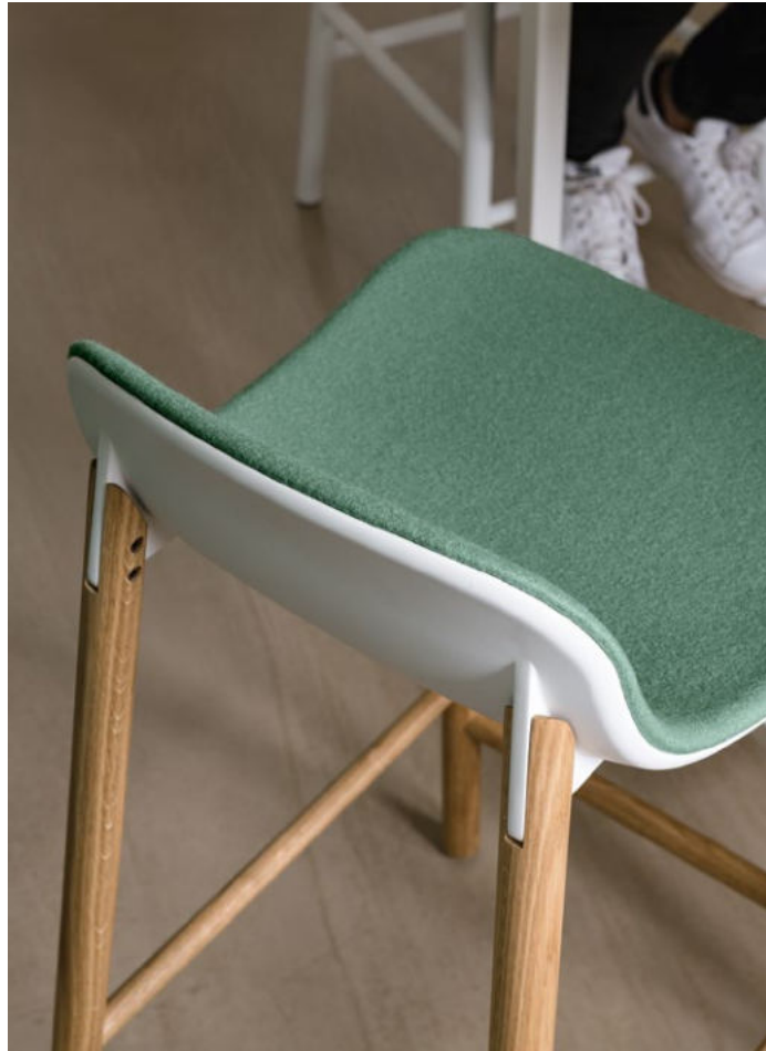
Sharky stool - wooden base Low back frontal upholstered Hero fabric