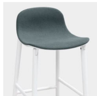
Frontal upholstered version