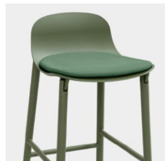
Sharky removable cushion