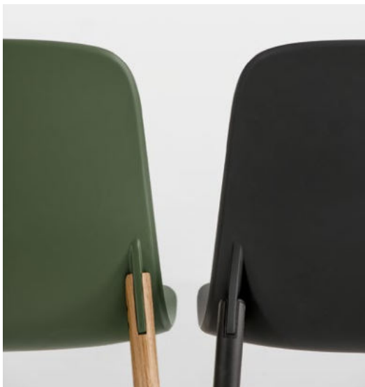
Wood and painted aluminium legs