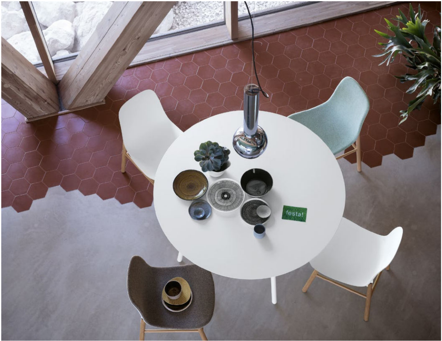
Sharky chair - wooden base Polyurethane body / Frontal upholstered Divina MD fabric