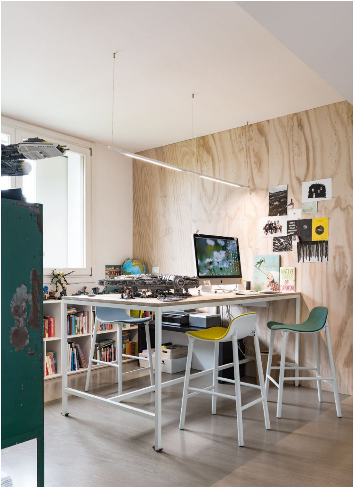
Sharky stool - aluminium base Low back frontal upholstered Hero fabric