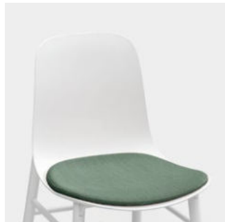
Sharky removable cushion