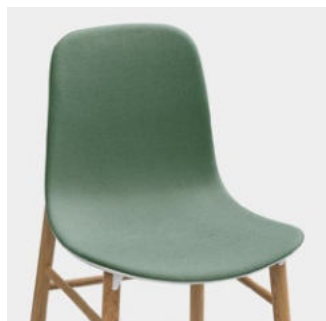
Frontal upholstered version