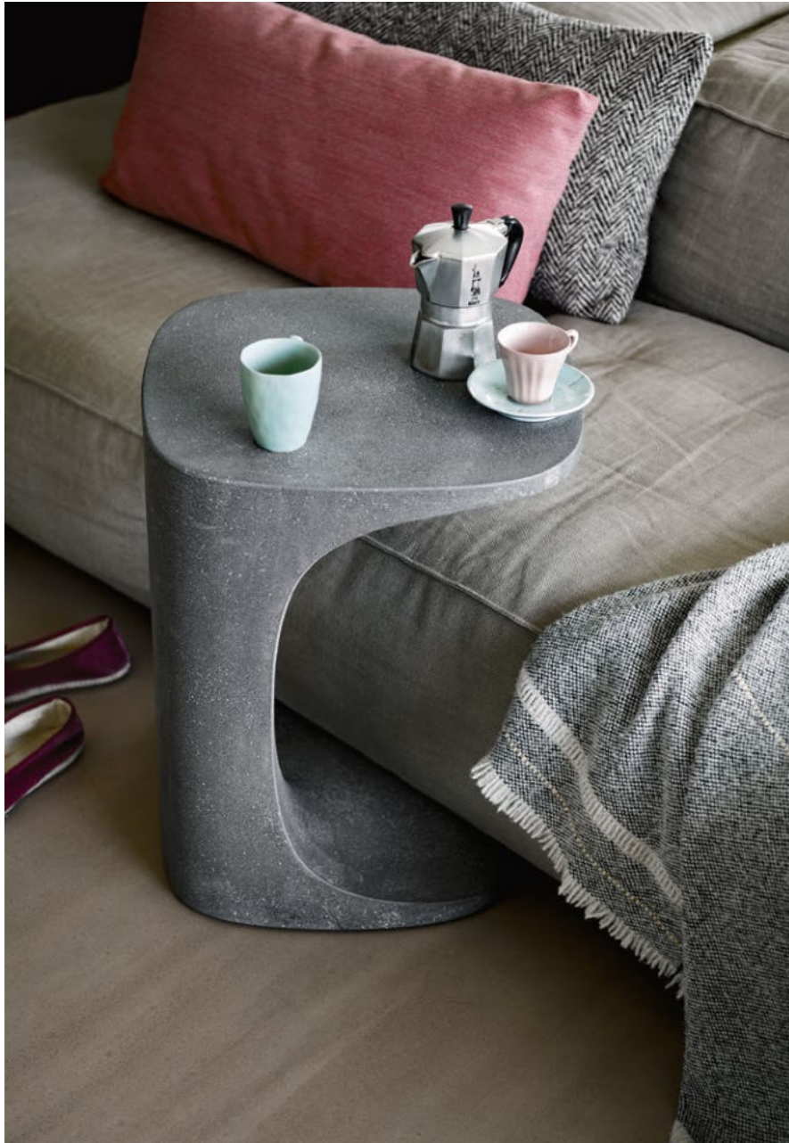
Font occasional table Cement