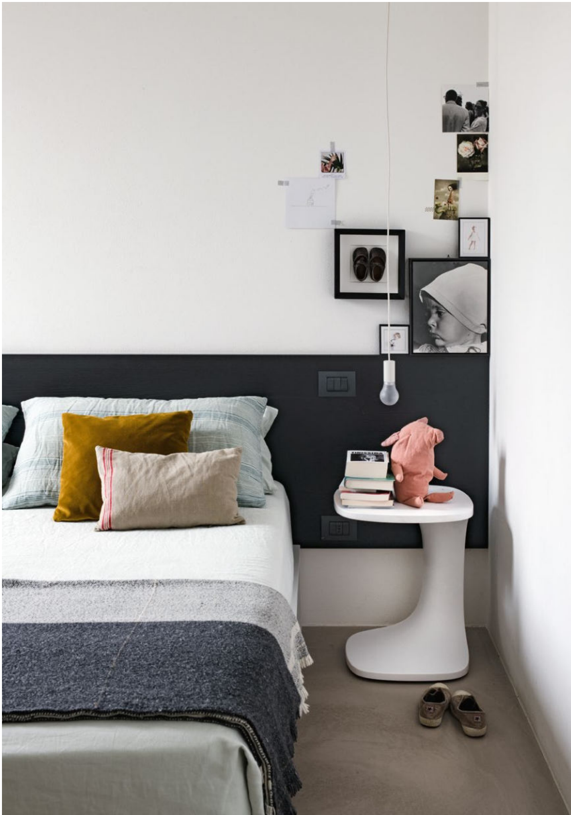
Font occasional table Cristalplant®