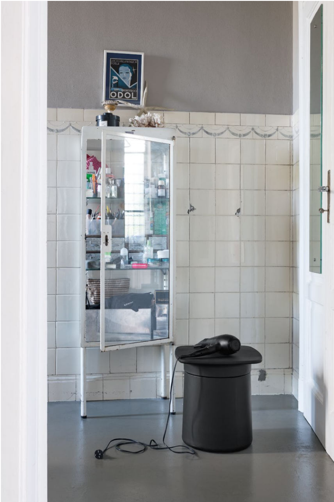
Degree occasional table Polypropylene