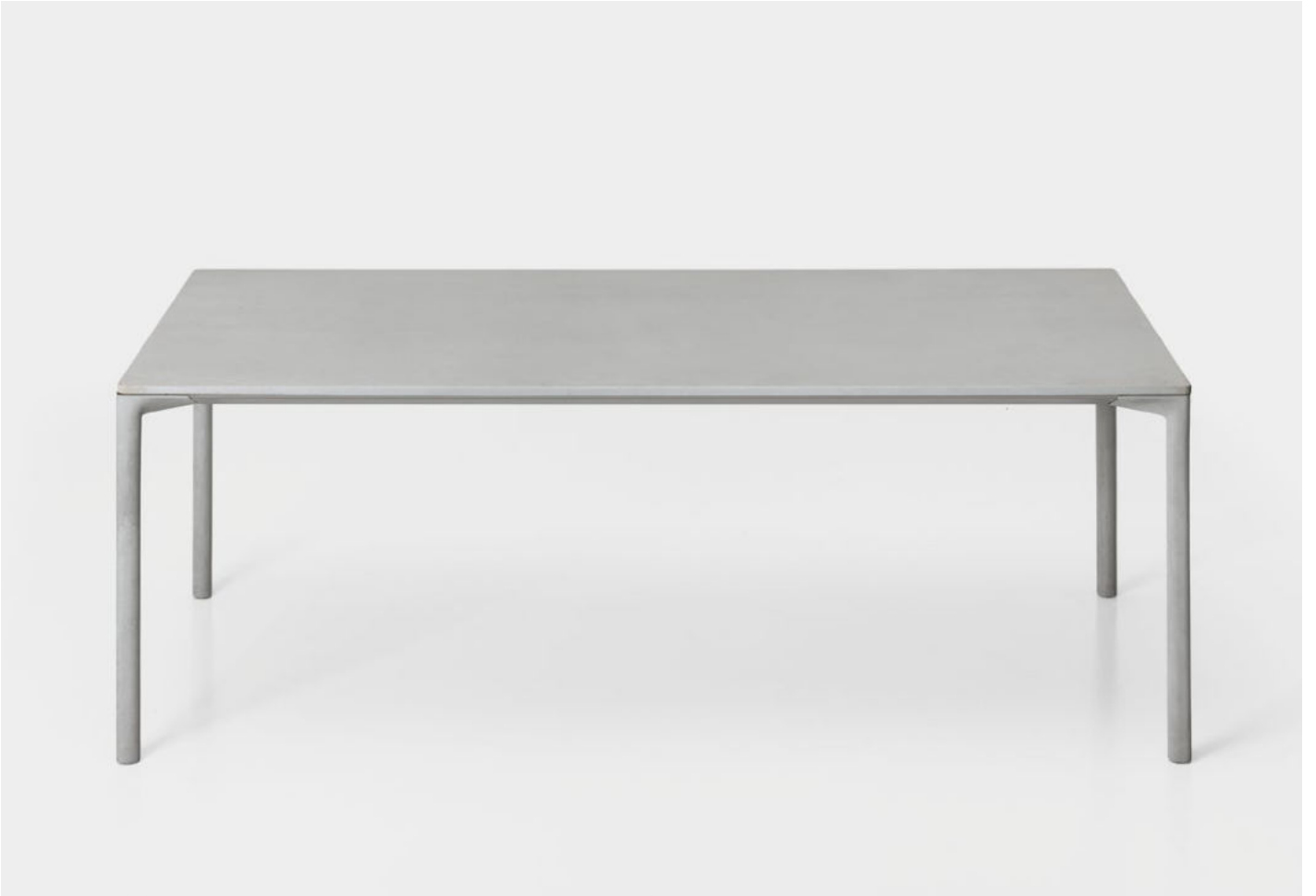
Boiacca table Cement version