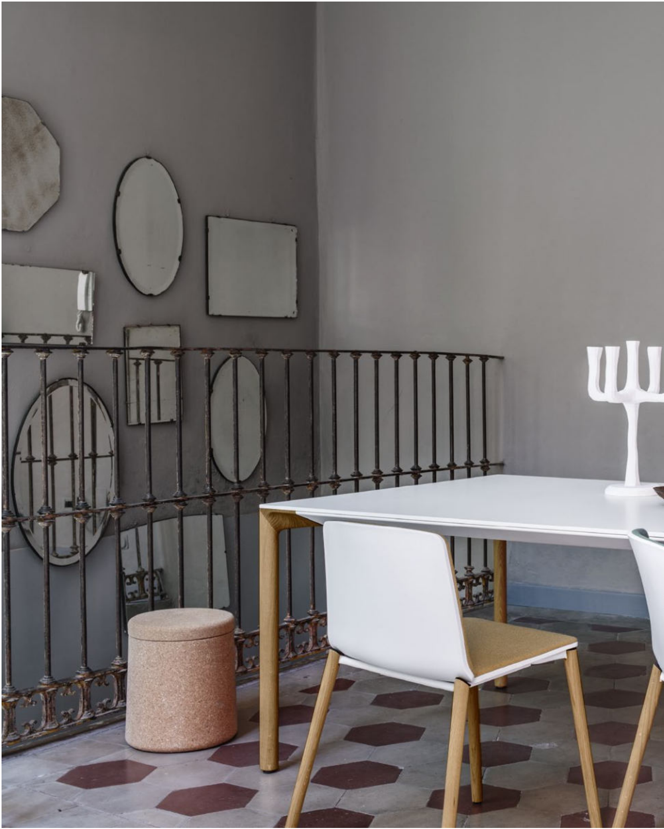
Boiacca table Wood version