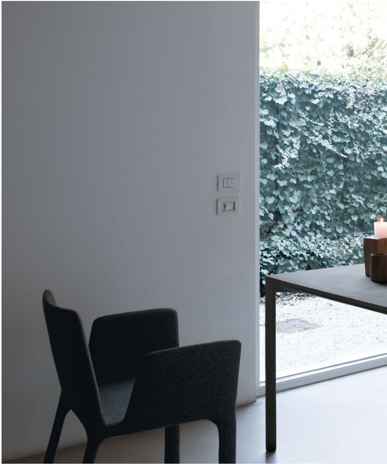
Boiacca table Cement version