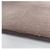
Tea Rose Amazing Grey