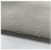
Amazing Grey Tea Rose