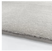
Simply White Simply White