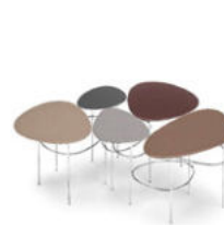
Viae 5 FG 484.00