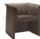
Parentesi FG 422.00