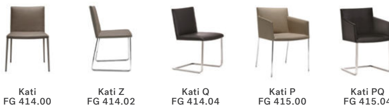
Kati FG 414.00