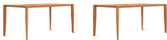
Dante 150 FG 366.00