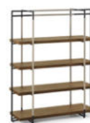
Bak Bookcase FG 440.10