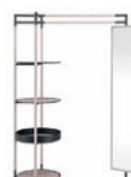
Bak MirrorFG 440.01