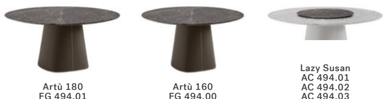
Artù 180 FG 494.01