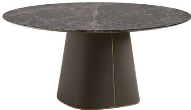
Table with leather-upholstered base and metal details in brushed brass finish. Top in marble. Feature a brushed brass metal bar that divide and enriches the top. Lazy Susanne in marble available upon request.

Tavolo con base rivestita in pelle e dettagli in metallo con finitura ottone spazzolato. Top in marmo. Barretta in metallo che divide e impreziosisce il piano. Su richiesta, vassoio girevole in marmo.