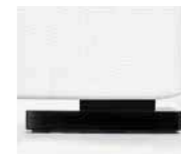
nero black noir negro