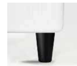
nero black noir negro