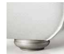
argento silver argent plata