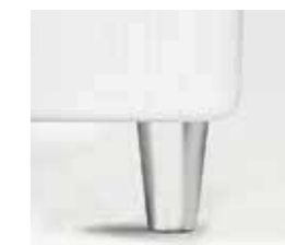
argento silver argent plata