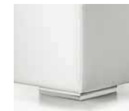
argento silver argent plata