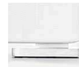
bianco white blanc blanco