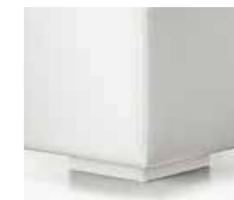
bianco white blanc blanco