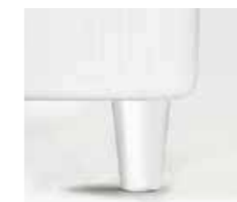
bianco white blanc blanco