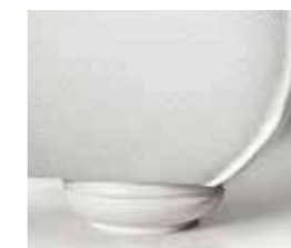
bianco white blanc blanco