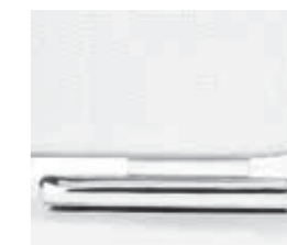
cromo chrome chrome cromo