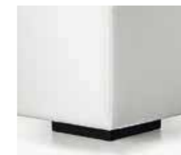
nero black noir negro