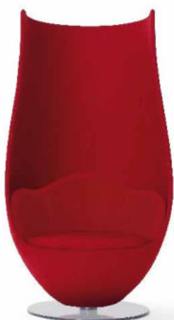
WANDERS' TULIP ARMCHAIR