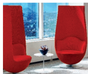
WANDERS' TULIP ARMCHAIR