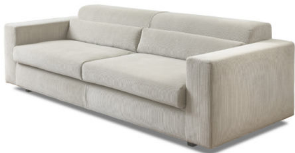
PETIT QUACK 2020

Collection of seating elements made up of armchair and two or three-seater sofa with kidney cushions and black plastic feet. Removable cover in fabric and fixed cover in leather.