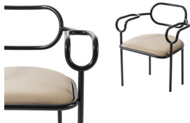
seduta con braccioli - chair with armrests

Originally designed by Shiro Kuramata in 1979, 01 Chair pays homage to the 80s and to the refined Japanese designer, who started to collaborate with Cappellini in that decade. The structure, made of polish chromed or anthracite matt lacquered iron tube, draws a light volume, characterized by the succession of lines and arches sinuously intertwined. The seat upholstery is fixed in the leathers of the collection.