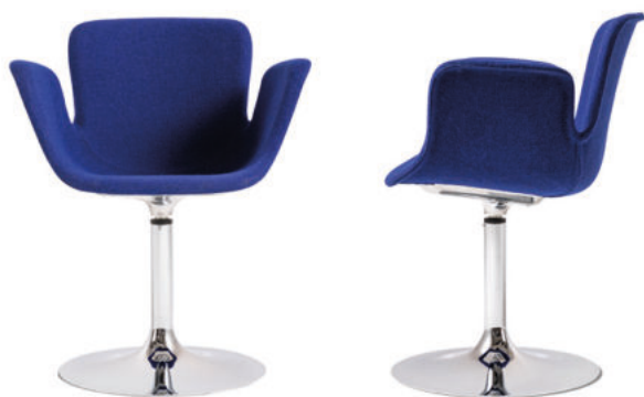
con scocca rivestita - with upholstered shell

Fully upholstered in fabric, the Juli Soft armchair sits on top of a base that comes in following versions: a column base; with 4 ash legs; with 4 or 5 aluminum legs; 4 tubular iron legs; with a sled base. Thanks to its remarkable stability, the robust injection-molded seat and the fresh, contemporary look, the Juli Soft armchair is the perfect solution for home and Contract settings, such as offices and restaurants.