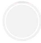
Hpl all white