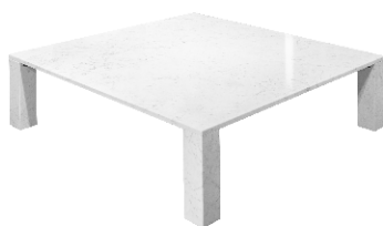
marmo bianco Carrara - white Carrara marble