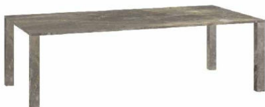
marmo grigio Roma - grey Rome marble

Giulio Cappellini drew from magnificent white Carrara marble and grey Rome marble for the Vendôme collection, which includes a range of dining tables with rectangular or square tops. The slender top rests atop four slightly thicker legs: these proportions give the table a light yet solid appearance. Elegant and sophisticated, in 2021 the Vendôme tables have expanded to include two new alternatives: a large rectangular table and a low-lying square side table.