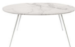
piano rotondo - round top

STY1 tavolo 140x140 / table 140x140 STY2 tavolo 180x90 / table 180x90 STY3 tavolo 220x90 / table 220x90 STY4 tavolo Ø140 / table Ø140 STY6 tavolo Ø180 / table Ø180