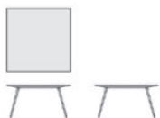
STY1 cm. 140x140x72h inch 55"x55"x28" 1 / 4 h