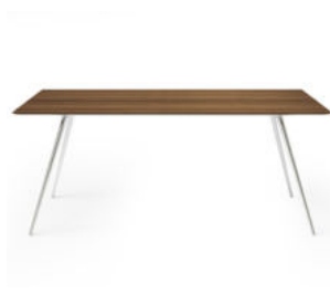
piano rettangolare - rectangular top

Rectangular, round or square table, with conical stainless steel legs in different finishing, top in a selection of woods and marbles, matt or polished lacquer.