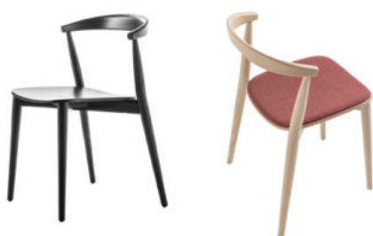
Newood Light chair

Newood Light stool is available in two heights and is made of solid ash wood, in the same tones as the other seats in the collection.