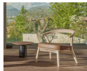
NEWOOD RELAX LIGHT