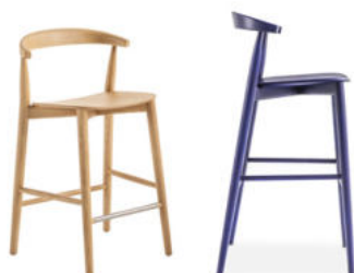
Newood Light stools