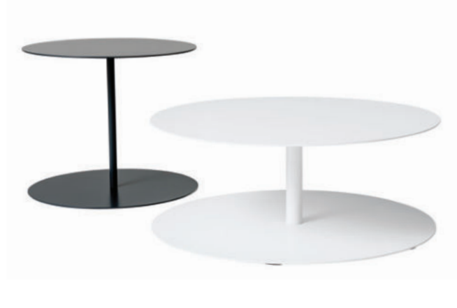
tavolini / service tables

GG_1 service table GG_2 low service table