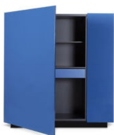
madia alta - sideboard

Madia in due varianti dimensionali con cassa laccata opaco color antracite e frontali laccati opachi o lucidi nei colori di collezione, oppure laccati lucidi metallizzati nei quattro colori selezionati.