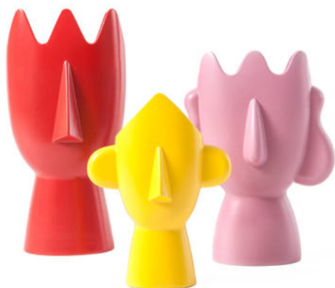
Diavoletto - Diavoletta - Diavoletto Baby

Collection of three different vases, available in one color for each version, manufactured in matt ceramic according to the ancient techniques of the 18th Century. A family of three odd and surrealistic elements, inspired by the ancient idols of Mykonos Cycladic culture. Diavoletto, Diavoletta and Diavoletto Baby form a contemporary mysterious triptych, a lucky charm to exorcise deeds and misdeeds of everyday life.