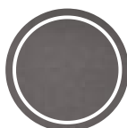
Table tops available