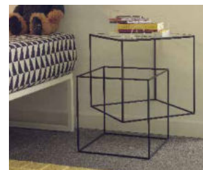
THIN BLACK TABLE

Lucky | Peg Bed | Peg Chair | Koeda | Tuta | Waku