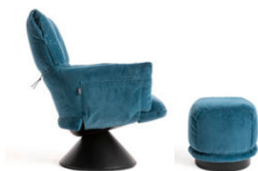
con base conica e pouf / with conical base and ottoman

A relaxing armchair characterized by great innovation, both for its shape and its manufacturing system. A structure made of recycled plastic material hosts a soft dress, available in different fabrics or leathers. With a simple gesture, one can remove the entire padded upholstery, giving Lud'o an ever-changing look. Not an armchair with a removable cover, but an armchair with a removable dress, marked out by great comfort. An immediate and highly recognizable image makes this product an important chapter in contemporary seating evolution.