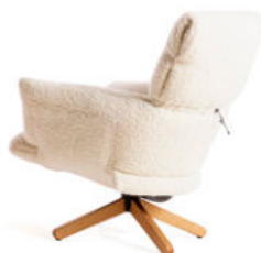
con base a 4 razze in legno / with 4-spoke wooden base