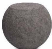
lava vulcanica / lava stone