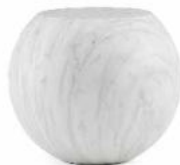
bianco Carrara / white Carrara