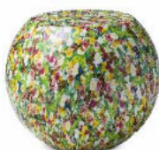
floreale / floral

Bong è un tavolino in vetroresina rinforzata, realizzato con un processo sviluppato e brevettato da Cappellini. Sia il materiale che il processo produttivo rendono questo prodotto estremamente leggero, ma robusto e resistente al tempo stesso. Bong è disponibile in diverse varianti: finitura laccata opaca, in una selezione di colori; finitura lava vulcanica, prodotta con vera polvere di lava del vulcano Etna; finitura finto marmo e floreale, entrambe realizzate con il sistema di decorazione tridimensionale Dip-Print.