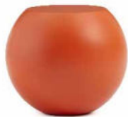
laccato opaco / matt lacquer